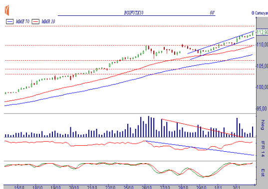
GRÁFICO BOI OUTUBRO BM&F (BGIV10)