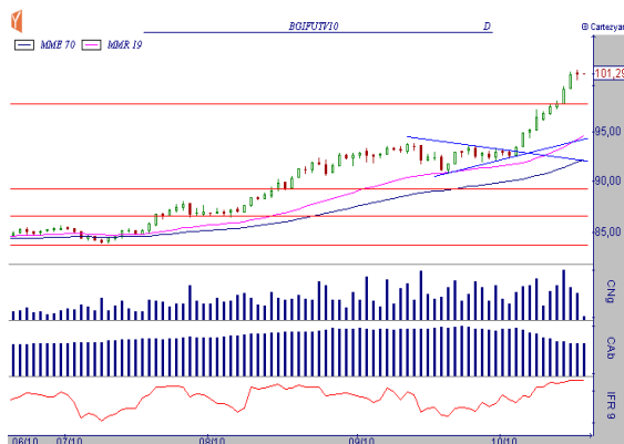
GRÁFICO BOI OUTUBRO BM&F (BGIV10)