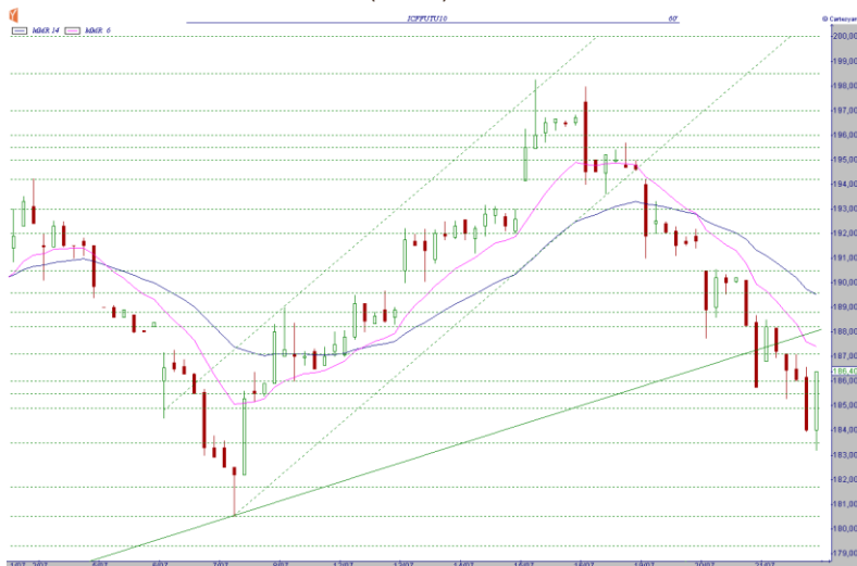
GRÁFICO CAFÉ SETEMBRO NY (KCU10)