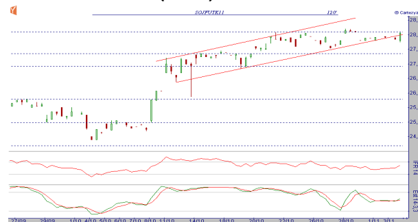
GRÁFICO SOJA MAIO 11 (SOJK11) BM&amp;F